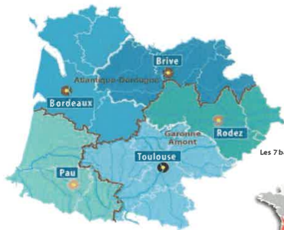
Les 7 bassins hydrographiques métropolitains

Tél. : 05 61 36 37 38 | Fax : 05 61 36 37 28